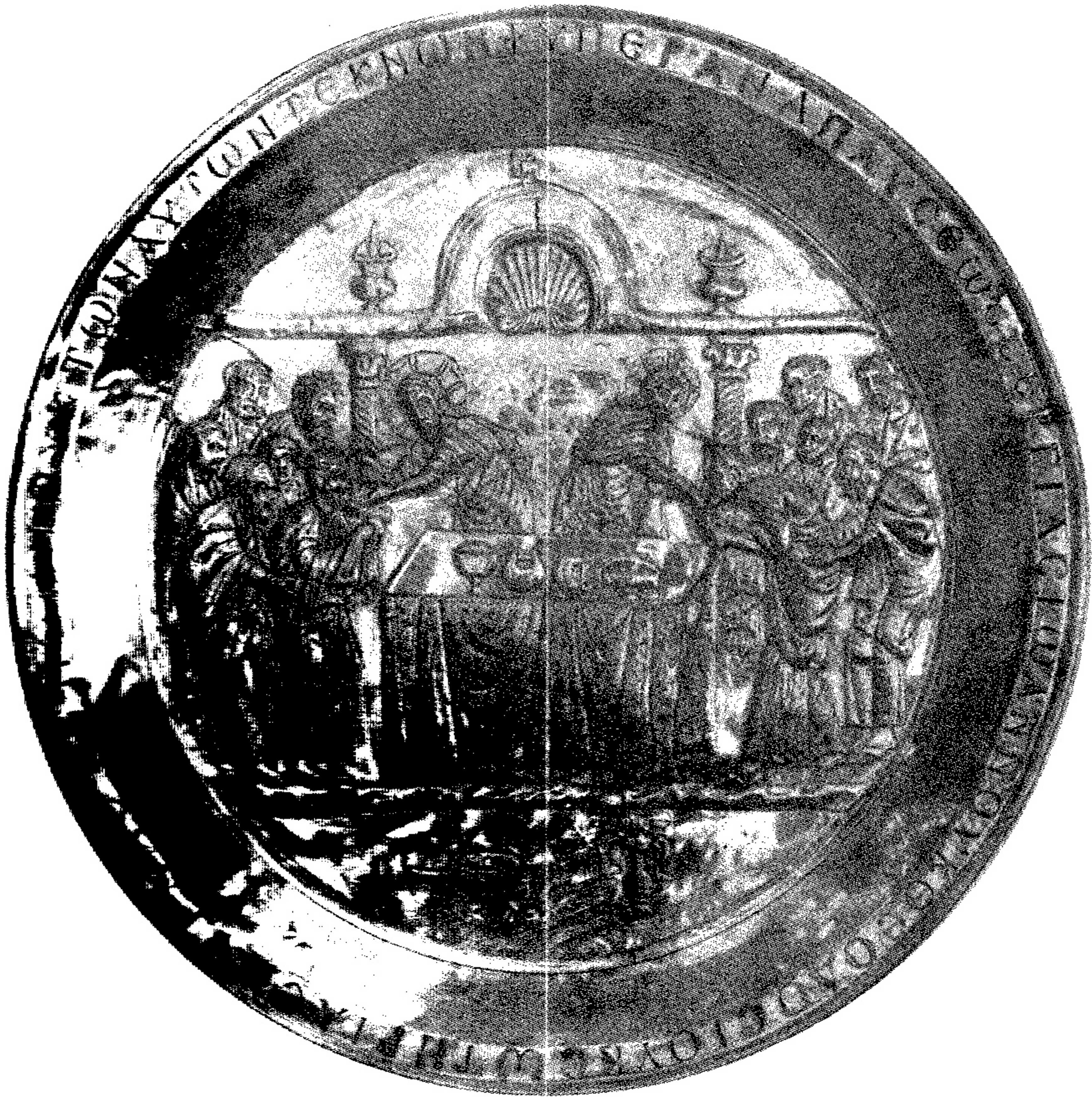
Disc de argint secolul V (Siria)

Împărtașirea apostolilor sub ambele forme Metalepsis - stânga (vinul) și Metadosis - dreapta (pâinea)