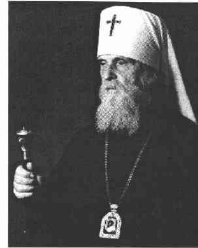
Mitropolitul Vitalie al Bisericii Ruse din Exil

Nimeni nu va putea fi izbăvit atunci prin grade teologice sau prin cunoașterea tipicului slujbelor bisericești sau prin orânduierile episcopului sau preotului sau ale oricărei alte tagme. Numai o dragoste personală, izvorâtă din adâncul inimii pentru Mântui- torul nostru, Domnul Iisus Hristos, și credințioșii până la moarte față de El vor avea putere să izbăvească sufletul omenesc.