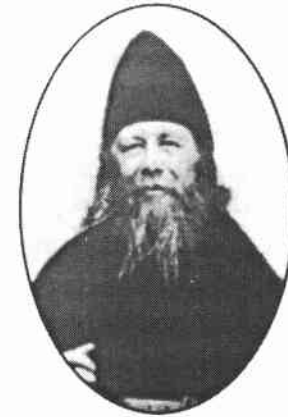
POVĂȚUIRE ȘI ÎNAINTEVESTIRE 1 ale Sfântului Anatolie al Optinei (1855-†1922)

Deci, fericiți vor fi câți nu se vor pleca la cea mai mare fărădelege a necurăției, care este mai silnică și mai grea decât uciderea, ci se vor împotrivi și vor muștra fărădelegea ca Sfântul Ioan Botezătorul, și vor stărui muștrând amestecarea de sânge. Și vor fi uciși de cei prea fărădelege, spurcați și prea necurați oameni din vremea aceea și apoi se vor odihni în sânul lui Avraam, Isaac și Iacov, al preaslăviților Patriarhi, și vor locui în Împărăția Cerurilor cu toți Sfinții, bucurându-se și veselindu-se, de care [bucurie] să ne învrednicească Dumnezeu și pe noi, cu darul Lui cel Sfânt. Amin.