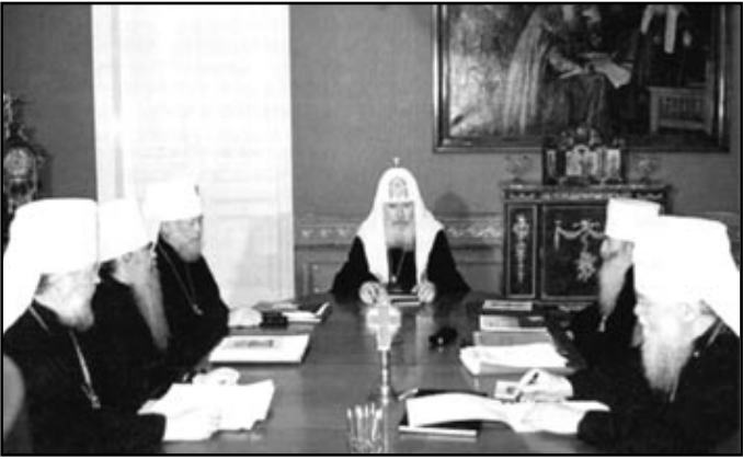
Secvență de la ședința de lucru a Sfântul Sinod al Patriarhiei Moscovei

Patriarhul Moscovei și a toată Rusia ALEXII al II-lea 9 octombrie 2000, Moscova