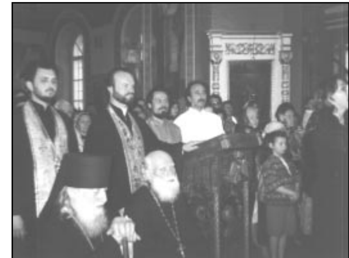
Preoții și enoriașii bisericii Sf. Dumitru din Chișinău primesc colindătorii

începutul anului, când se anunțau sărbătorile de peste an. Datorită faptului că în primele veacuri creștine Nașterea Domnului se prăznuia, așa cum am arătat, la 6 ianuarie, atunci se anunțau data Paștilor și ale altor sărbători de peste an, dându-i-se numele vechii sărbători calatio . De altfel, acest obicei s-a păstrat până în zilele noastre, distribuirea calendarelor religioase nefiind altceva decât un mod modern de a anunța sărbătorile din cursul anului. O serie de tradiții însoțesc celebrarea Nașterii Domnului. Aceste tradiții diferă de la un popor la altul, dar pretutindeni întâlnim obiceiul de a înălța imnuri religioase cu referire la evenimentul Întrupării Domnului. La români această tradiție îmbracă un aspect deosebit - colindatul.