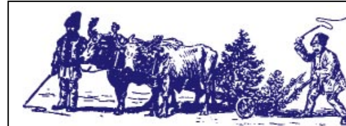
Plugușorul este o altă tradiție legată de sărbătorile de iarnă

Nici o clipă comunismul impus nu a însemnat pierderea identității spirituale a poporului nostru. Postul, rugăciunea, purificarea spirituală prin Sfintele Taine, bucuria colindelor, nădejdea în milostivirea