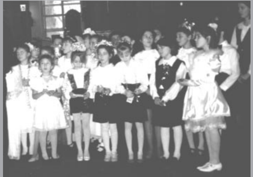
Corul scolii duminicale "Sf Dumitru" din Chișinău a venit cu colinda la biserica "Sf. Ierarh Nicolae"

Colinda este un cântec de urare popular religios, tradițional, cântat de copii sau chiar de adulții care colindă, adică merg din casă în casă, în ajun de Crăciun și de Anul Nou. Orice colindă are un refren: "Florile Dalbe", "Leroi, Doamne", etc.