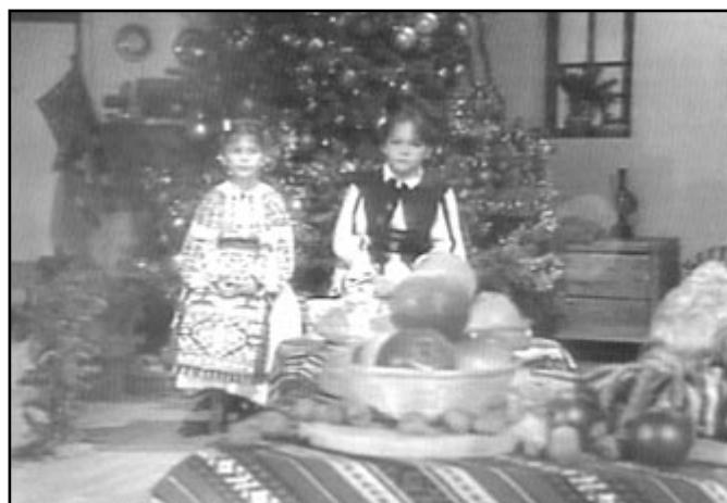
Micii colindători vestind Nașterea Domnului

Colindătorii le cântă cu încredințarea că sunt solii unei lumi mai bune, cu binecuvântarea Domnului