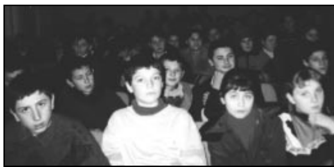
Secvență de la una din lecțiile oorganizate de "CASTITAS"

Asociația Națională pentru Sănătatea Familiei "CASTITAS" a fost fondată pe data de 27 aprilie 2000 la Chișinău și este o organizație obștească, republicană, non-profit, neguvernamentală, apolitică, constituită prin libera manifestare a voinței persoanelor asociate, în vederea realizării în