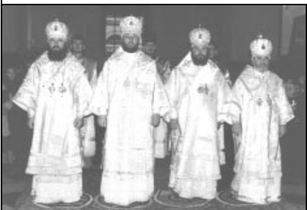
Arhieriei Bisericii Ortodoxe din Moldova

Această iubire nemărginită, dumnezeiască nu a îngăduit ca făptura cea mai aleasă a lui Dumnezeu să fie înghițită de piere, nu a îngăduit ca păcatul să biruiască firea și să o îndepărteze de ziditorul ei. Căci omenirea era vrednică de judecata și pedeapsa lui Dumnezeu pentru păcatele ei. Dumnezeu s-a apropiat de oameni, i-a mângâiat, le-a tămăduit rănilor trupești și sufletești, i-a luminat cu învățătura Sa, le-a sfințit bucuriile, S-a jertfit pe cruce ca să-i răscumpere din robia păcatului și din osânda morții, iubirea Lui fiind legată de însăși ființa lui Dumnezeu, precum ne spune Sf. Evanghelist Ioan: "Dumnezeu este iubire" (I Ioan 4,16).