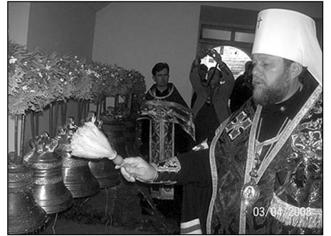
Sfințirea clopotelor la mănăstirea Rudi