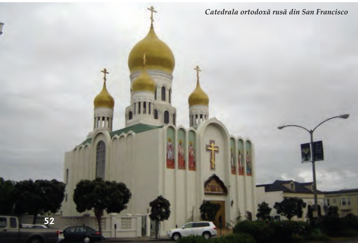
Catedrala ortodoxă rusă din San Francisco