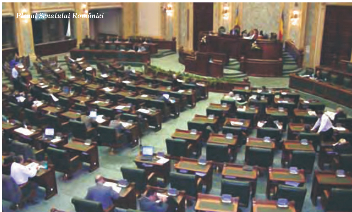
Plăcuța Senatului României

Toate aceste demersuri au fost întărite de un apel al părintelui Justin Pârveu adresat special parlamentarilor. Din cadrul acestui apel, spicuiim: „Rugându-vă să mă iertați, găsesc de cuviință să vă adresez sentimentele mele de ortodox român și mărturisitor: ne găsim în fața unor stări de lucruri cu totul neobișnuite. Nu e vorba de o problemă financiară, economică sau teritorială, ci este vorba despre ducerea unei națiuni spre pierzanie, este vorba despre un act care are urmări asupra copiilor și nepoților noștri... Noi nu avem nevoie de sisteme de control - de acte de identitate electronice, de cărți de identitate, de carnet de conducere