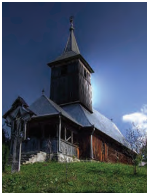
Biserica de lemn din Urișiu de Sus, sec. XIX.

Afirmațiile de acest tip au fost reluate și în cadrul unei „mese rotunde” organizată de Liga Pro-Europa , principalul aliat al luptei pe care Zaharie Fărcaș o duce de mai mulți ani pentru a dobândi proprietățile B.O.R. din zonă: „ Un singur preot ține patru biserici, ortodocșii easta fiind a noastră, la Urisiu de Sus. El