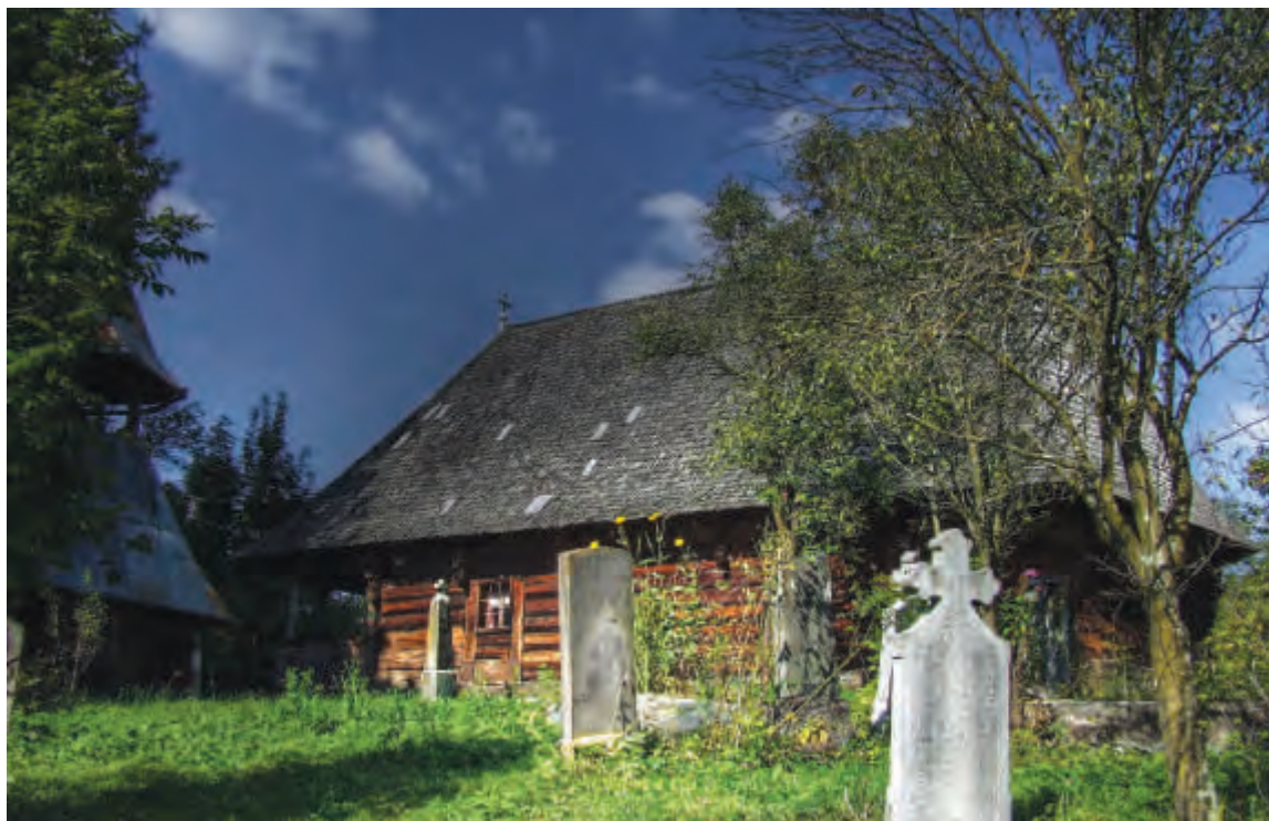
Biserica din Urișiul de Jos, datând din anul 1748 și declarată monument istoric.

nu vor să ne dea biserica, aceasta fiind a noastră, la Urisiu de Sus. El celebrează doar o singură liturghie într-o duminică sau de sărbătoare, celelalte sunt încuiate. Nu cerem altă biserică, ci pe a noastră. Și a fost și o hotărâre de instanță în care se puteau celebra slujbele alternativ. Atunci ne-a amenințat: «Ce, vrem lupte de stradă?». Deci instigă populația împotriva noastră.»