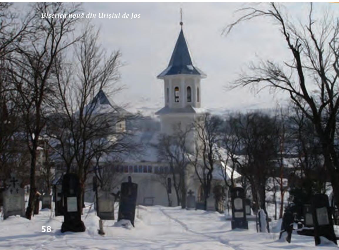
Biserica nouă din Urișiul de Jos